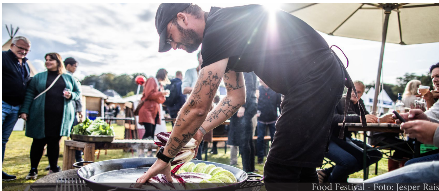
Food Festival - Foto: Jesper Rais

Hovedfokus for hvervning og udvikling af events i Aarhus vil være på sport og kultur samt events der skaber øget turisme i Aarhusregionen.