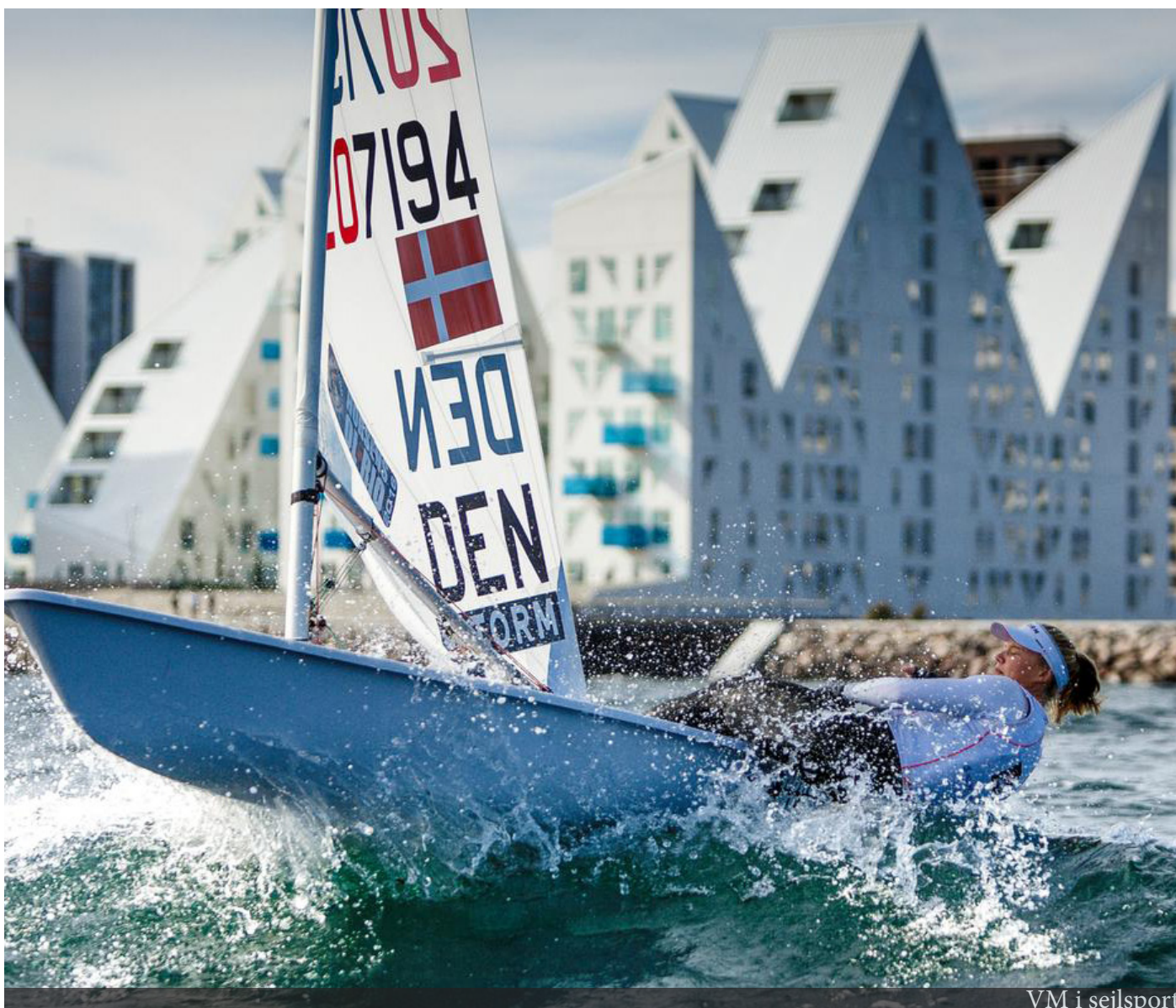
VM i sejlsport

Derudover igangsættes undersøgelser af mulighederne for at lave en fælles indkøbsordning for eventaktørerne, samt muligheden for at lave en materielbank, hvor aktørerne kan låne/købe materialer af hinanden. Tiltagene kan sikre, at alle eventaktører får råd til bæredygtige materialer, f.eks. emballage, ligesom de skal sikre, at vi genanvender så mange materialer som muligt. Undersøgelsen skal vise, om det er ladsiggørligt, og i så fald hvordan.