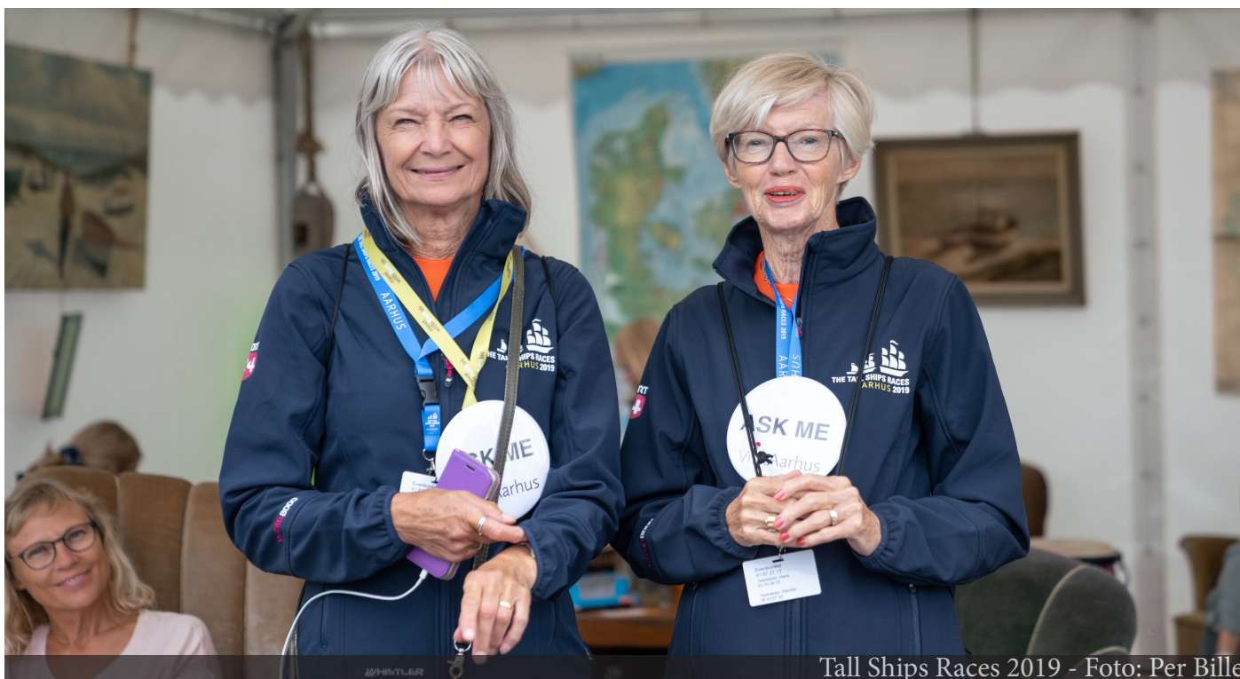
Tall Ships Races 2019

I Aarhus er der tradition for at engagere sig i lokalmiljøet og events har typisk let ved at rekruttere frivillige til gennemførelsen af arrangementer. Et af de helt store eftermæler fra Kulturhovedstad 2017 og Frivillighedsåret 2018 er frivilligprogrammet ReThinkers, som er forankret i VisitAarhus. Med dette program har Aarhus fået en enestående stor kreds af aktive frivillige, som ikke er forankret i en forening, men hvor fællesskab er det lim der holder gruppen sammen. De frivillige ReThinkers er aktive i mange forskellige typer af events og i forskelligt omfang.