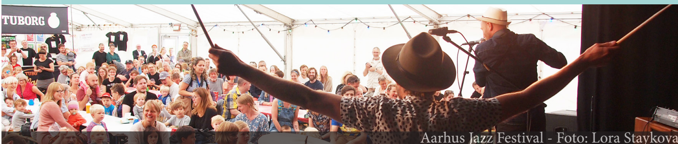
Aarhus Jazz Festival