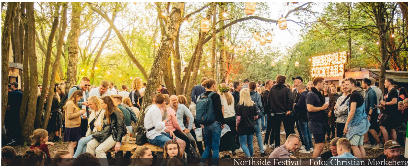
Northside Festival

Der er fortsat brug for, at Aarhus laver gode rammer for arbejdet med omstillingen, og med Eventstrategi 2020-2025 sættes der i de kommende år ekstra fokus på grøn omstilling gennem to særlige indsatsområder.