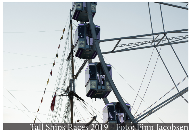
Tall Ships Races 2019

Det vurderes, om byen har de fysiske rammer til eventen, eller om de kan tilvejebringes. Kan vi bruge nogle af de pladser eller steder i byen, der normalt ikke benyttes så meget, eller kan vi gentænke brugen af eksisterende pladser. Dette kan også indebære fysiske rammer og rum, som ligger i udsatte boligområder.