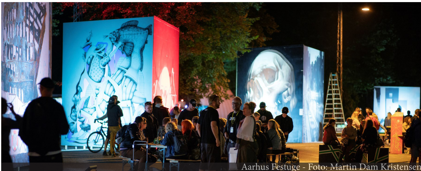
Aarhus Festuge