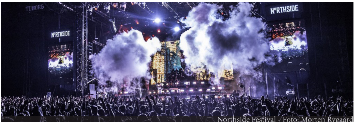
Northside Festival - Foto: Morten Rygaard

Afhængig af eventens karakter, spiller Aarhus Kommune forskellige roller. I mange tilfælde som rådgiver og sprintspartner, og i andre tilfælde er kommunen facilitator, der hjælper med få tingene til at ske. I nogle tilfælde indgår kommunen som direkte samarbejdspartner og endelig er kommunen lejlighedsvist også selv afvikler af events.