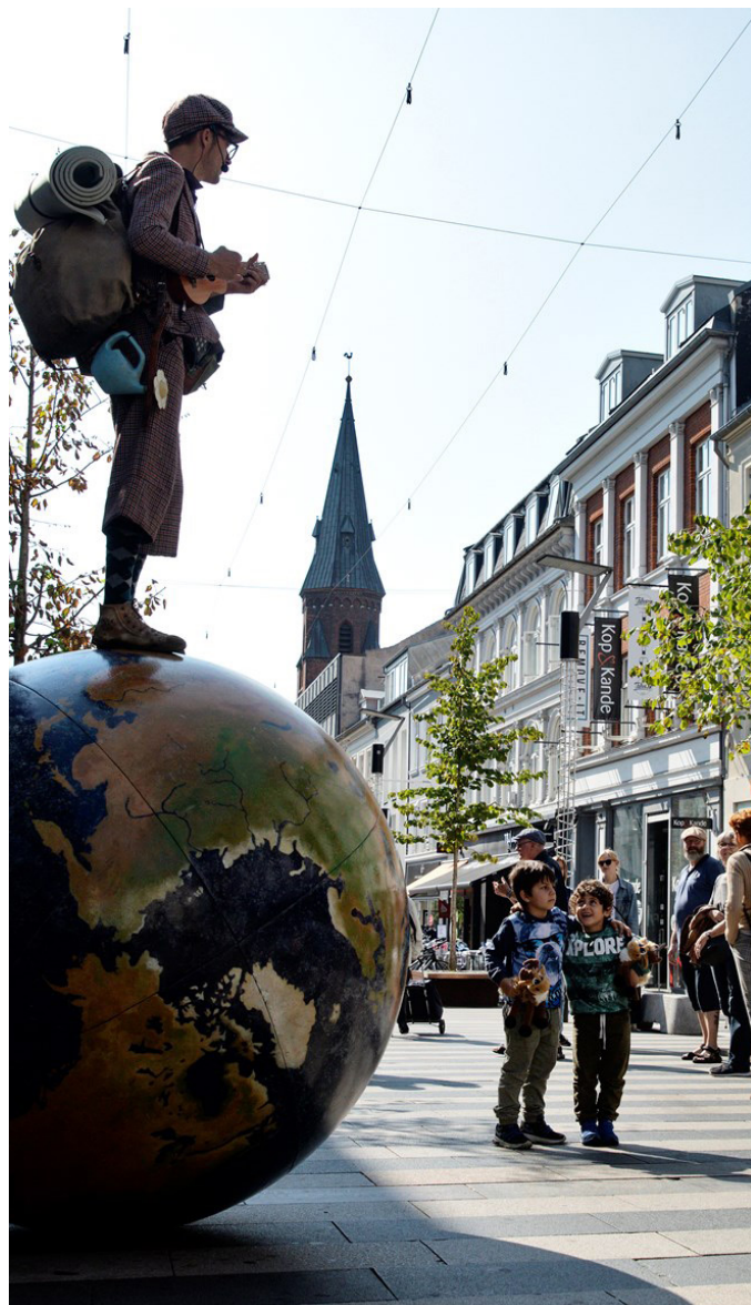
Aarhus Festuge - Foto: Martin Dam Kristensen

Som by skal vi være med til at skabe rammer og vilkår, som gør, at byens eventaktører kan udvikle sig og medvirke til at opnå eventstrategiens strategiske mål. Der afsættes derfor årligt 100.000 kr. i Event- og brandingpuljen i årene 2020-2025 til rådgivningstiltag, der skal komme eventarrangørerne til gode. Herunder skal der ske en videreudvikling af 'Grøn Konference- og Eventhåndbog' målrettet konkrete løsninger, som eventaktører kan målrette eget event. Desuden målrettes minimum ét af de årlige møder/medlemsbesøg i eventnetværket til et fokus på bæredygtighed og grøn omstilling.