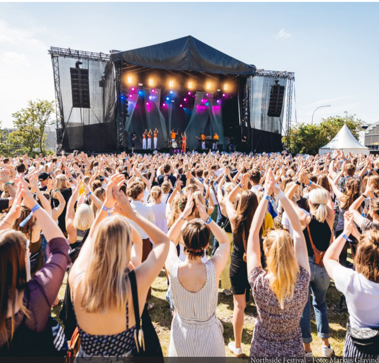
Northside Festival