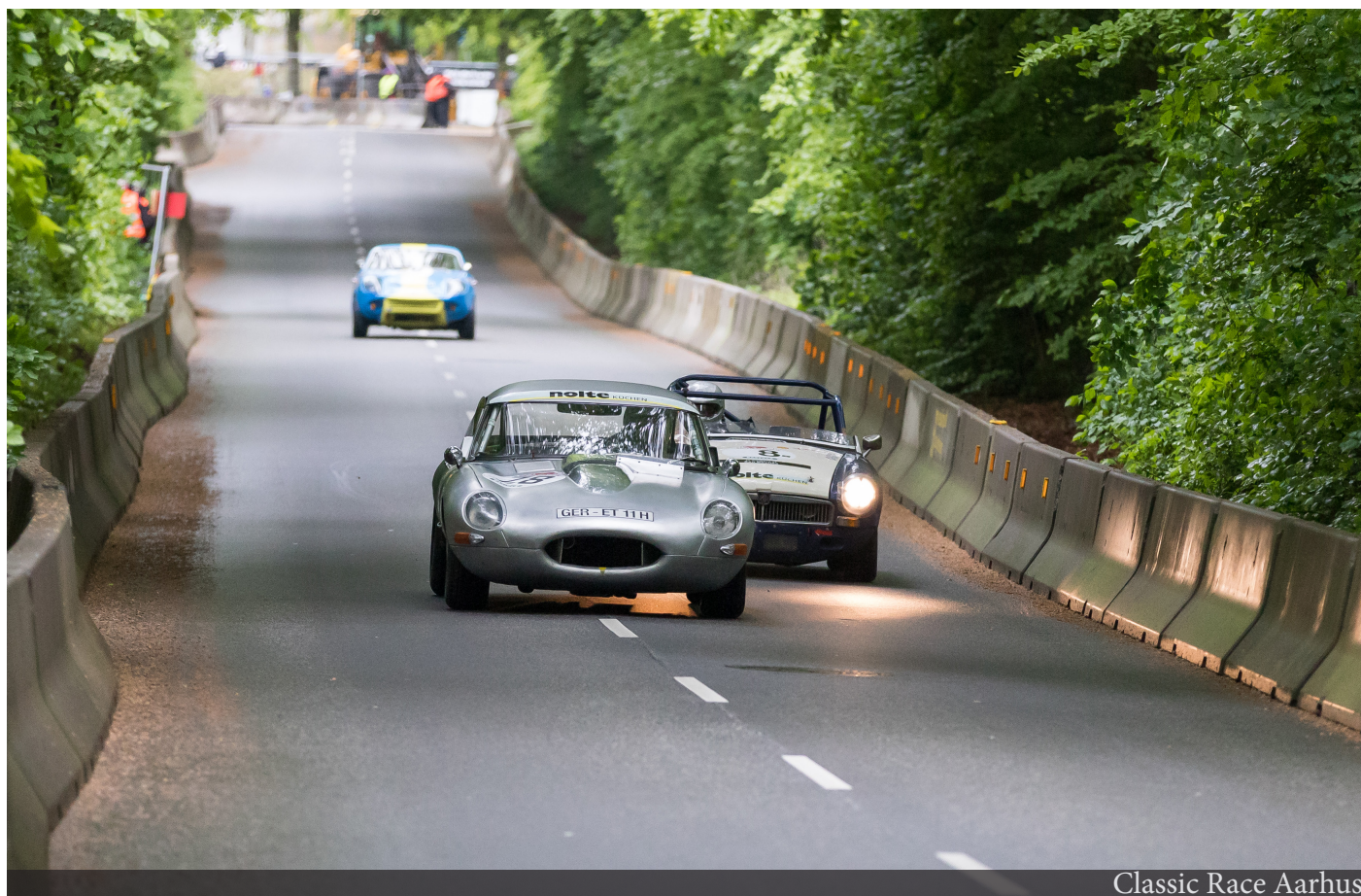
Classic Race Aarhus

Aarhus Events skal afklare om Foreningen Sport Aarhus Events med fordel kan gentænkes, så det får et bredere fokus på tværs af brancher. Det skal undersøges, om der er grundlag for at etablere et bredere 'advisory board' som har en bred kobling til både sporten, kulturen og erhvervslivet. Udvikling og styrkelse af eventområdet i Aarhus indebærer fortsat en tæt kobling mellem erhvervsliv og kultur/events.