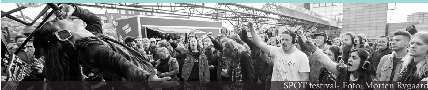
SPOT festival

Spørger man byens borgere, hvad der gør Aarhus til en god by, er svaret i høj grad kultur og herunder også events. Events skal derfor være inkluderende og engagerende. Eventstrategien skal først og fremmest bidrage til, at aarhusianerne får gode, mindeværdige og eksperimenterende oplevelser. De der lever i Aarhus, driver virksomhed, eller er her som turist og gæst skal ligeledes have interesse for events, enten som medvirkende aktører eller gæster. I Aarhus skal man kunne få alsidige oplevelser indenfor både sport, kultur, viden, folkelige traditioner mv.