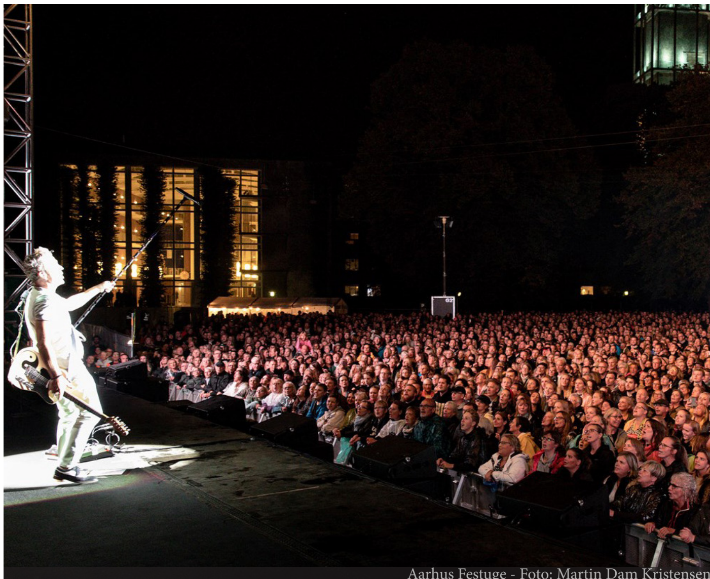
Aarhus Festuge

Det er hele byens overordnede ansvar, at events er en 'driver' til at sikre det gode liv i Aarhus og sikre at Aarhus er en god by for alle.