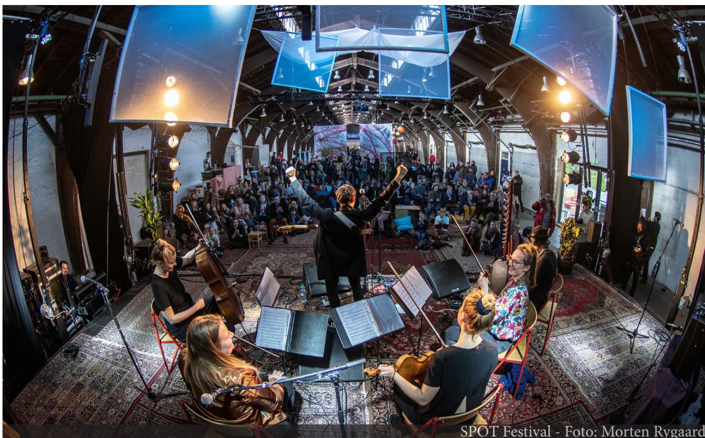
SPOT Festival

Aarhus som eventby bygger blandt andet på det faktum, at arrangementer og events bliver flere og flere, og varigheden af det enkelte arrangement ofte længere og længere. Det er grundlæggende positivt, men det aktive og levende miljø kan og skal ikke hegnes ind. Det betyder, at driften af byen udfordres. En levende og aktiv by medfører eksempelvis større nedslidning og mere affald i bybilledet, hvorfor der i perioden 2020-25 allokeres ressourcer til driften af byen til at opretholde det eksisterende drifts- og vedligeholdelsesniveau.